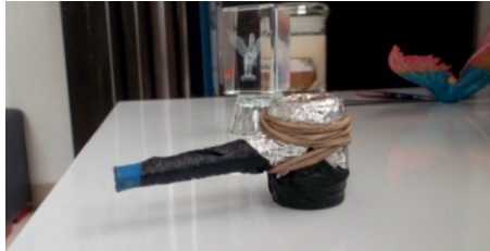
Figura 1. Pipa o llamado por los consumidores 'carro'.

Se han comparado los datos comunicados por algunos sujetos de la investigación frente al carácter, su madurez y su inmadurez; aunque es importante analizar que tiene más desventajas y una cotidianidad más difícil, aquel que como consumidor de bazuco es débil de carácter y no puede controlar el impulso de consumir compulsivamente.