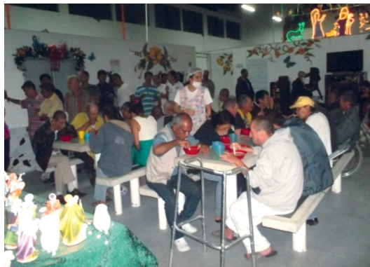
Figura 3. Diciembre de 2014, habitantes de La Casa.

Bruto refiere un elemento importante que habla del carácter social e individual, y es la angustia que los sujetos consumidores compulsivos de bazuco tienen tanto despiertos como dormidos, el cual es importante nombrar.